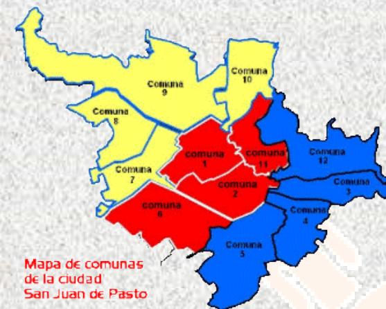
Mapa de comunas de la ciudad de San Juan de Pasto

El proyecto está inmerso en el proceso de integración de un nuevo orden mundial que existe en todo el planeta, cuyo signo es la unidad en diversidad , a través de la búsqueda y la implementación de nuevos modelos económicos, sociales, ambientales y culturales basados en relaciones sistémicas de interacción, reciprocidad, cooperación y servicio, participativas y horizontales , en claro contraste con el proceso de desintegración del orden vigente fundado en las relaciones de dominación, competencia, conflicto, imposición, conquista e individualismo extremo, cuyos signos principales son la homogeneización y la división que benefician a una minoría de la humanidad, lo que ha exacerbado los extremos de riqueza y pobreza y causado la afectación de varios factores ambientales que sustentan la vida en el planeta.